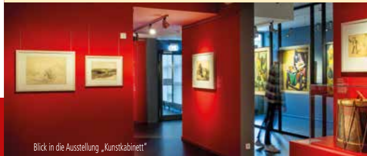
Blick in die Ausstellung „Kunstkabinett“