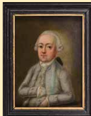
Portrait eines Buxtehuders, 1780 Pastell auf Pergament