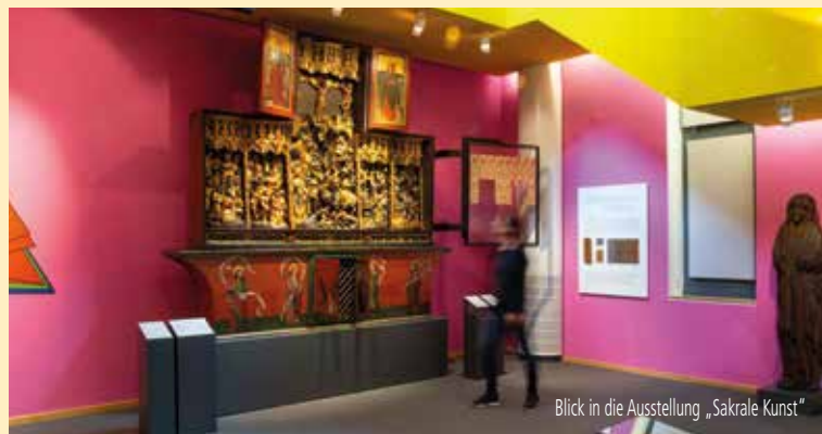
Blick in die Ausstellung „Sakrale Kunst“