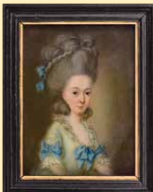
Portrait einer Buxtehuderin, 1780 Pastell auf Pergament