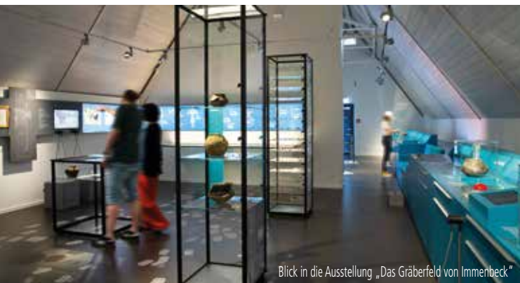
Blick in die Ausstellung „Das Gräberfeld von Immenbeck“